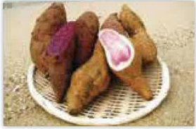
サツマイモ(紅イモなど) の生塊根