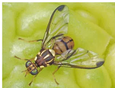
セグロウリミバエ成虫（体長8～9mm）