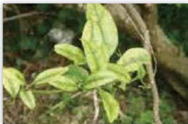
カンキツグリーンング病菌 (病気の症状)