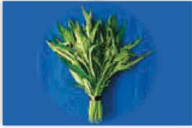
エンサイ(空心菜・ウンチーパー) の生茎葉