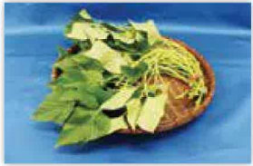
サツマイモ(紅イモなど) の生茎葉